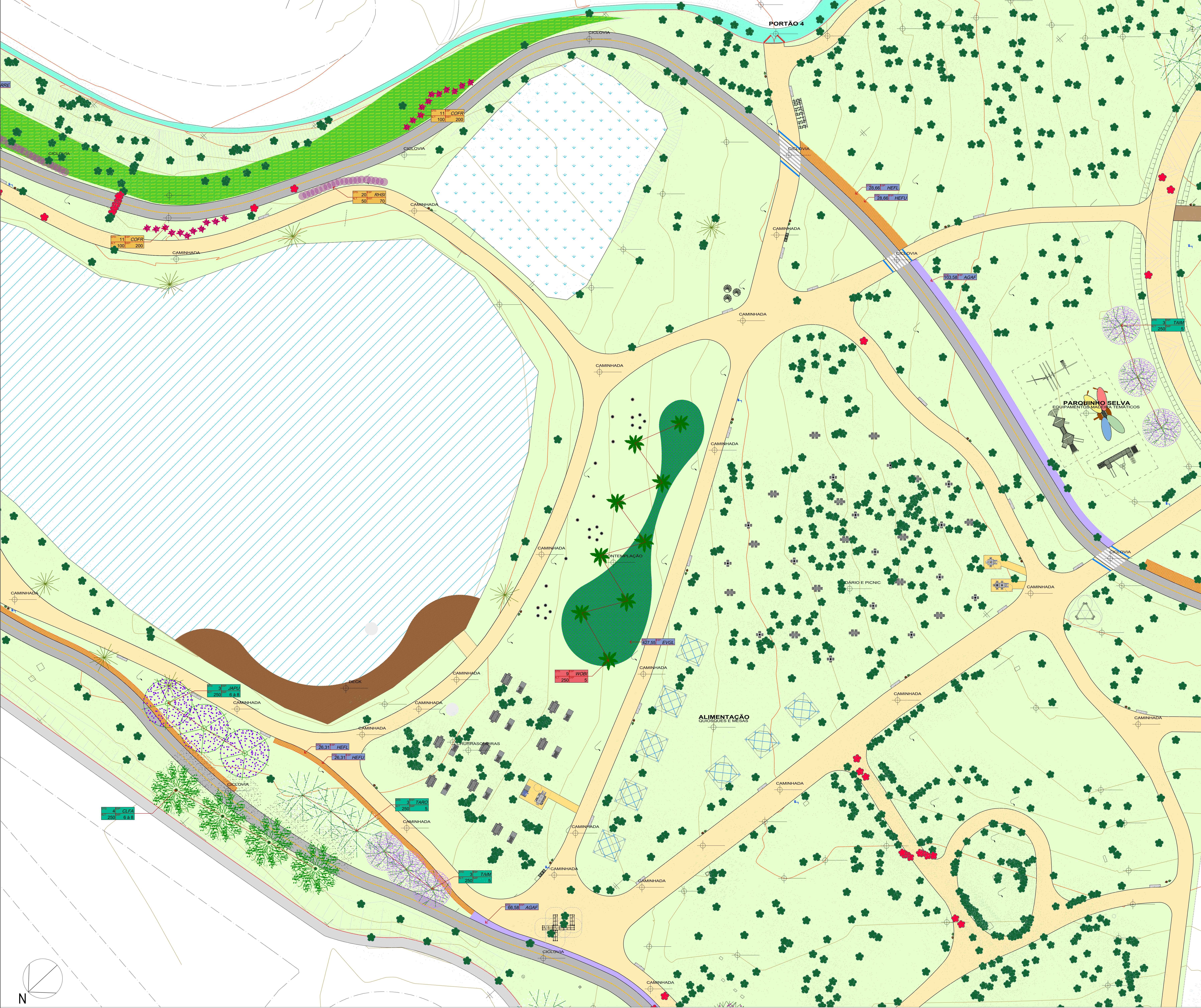
SETOR B - LAZER E ALIMENTAÇÃO escala 1 : 250