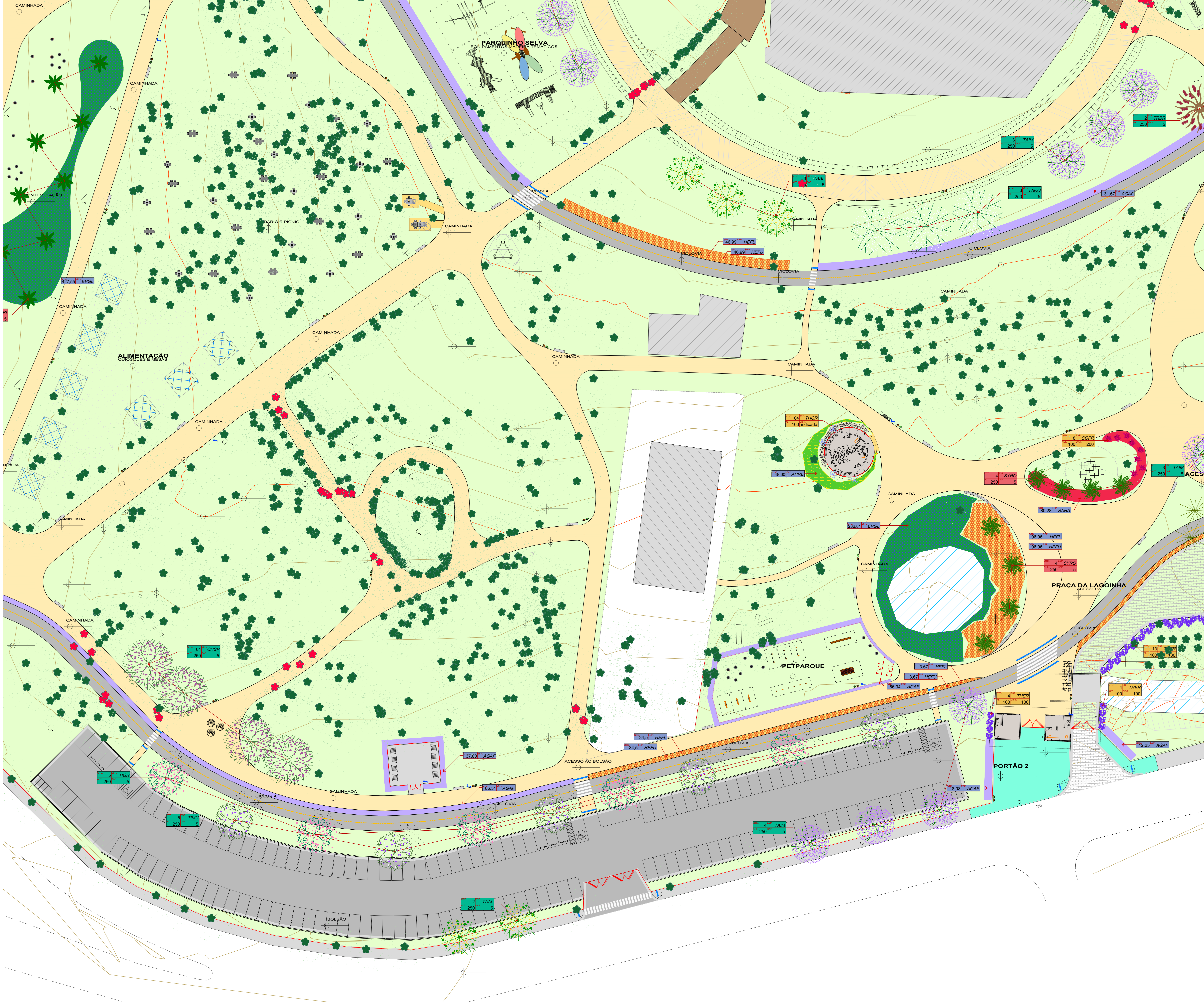
SETOR D - PORTÃO 2, BOLSÃO 2, RESTAURANTE escala 1 : 250